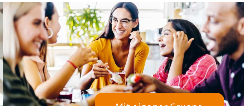
Mit eigener Gruppe

Ob du nach Orientierung suchst, Impulse brauchst oder einfach mal durchatmen möchtest – wir sind für dich da!