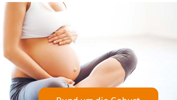
Rund um die Geburt