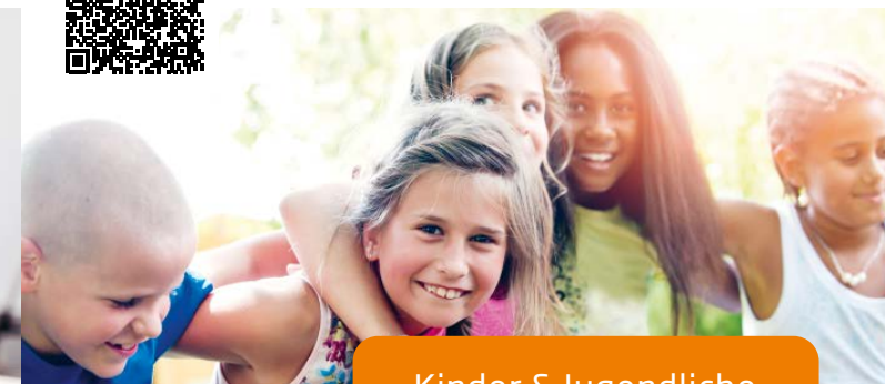
Kinder & Jugendliche